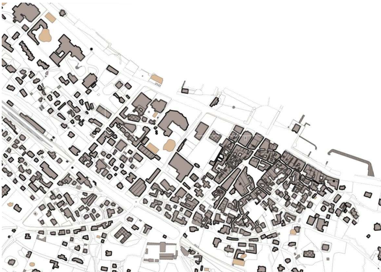
FOTO I - INQUADRAMENTO CARTOGRAFICO

Il Palazzo dei Congressi di Stresa ricade in un contesto urbanizzato di tipo storico ad alta densità abitativa, caratterizzato dalla presenza di nuclei insediativi originari tipici dei luoghi, alcuni dei quali di indubbio interesse storico-paesaggistico, come la Palazzina Liberty verso il centro storico, il Palazzo Ducale verso lago e gli alberghi storici sul versante ovest.